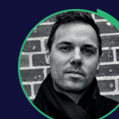
Julien Talpin Chargé de recherche en science politique au CNRS/CERAPS