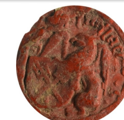
Sceau de Gérard Senellart

La combinaison des titulatures masculines et féminines (preuves indéniables de considération sociale) permet de porter un nouveau regard sur la société douaisienne sous l'angle du couple. La prise en compte des richesses familiales affine l'analyse. Le but est de mieux rendre compte des mobilités et immobilités sociales. Si certaines familles pénétrèrent les élites politiques en accédant à l'échevinage – plus ouvert qu'on ne le croit 7 – d'autres parvinrent à l'anoblissement ou entrèrent au service du duc. A Douai, les Senellart firent fortune grâce au brassage d'une bière légère type bacquebart . A la fin du XV e siècle, à force de persévérance (accumulation de patrimoine, constitution d'un réseau social, conclusion de mariages respectables), la famille accéda à la noblesse. Le 24 avril 1498, la demoiselle Isabelle Senellart fut mariée à l'écuyer Baudouin de Habarcq, futur bourgeois, qui finit par tenter l'expérience brassicole.