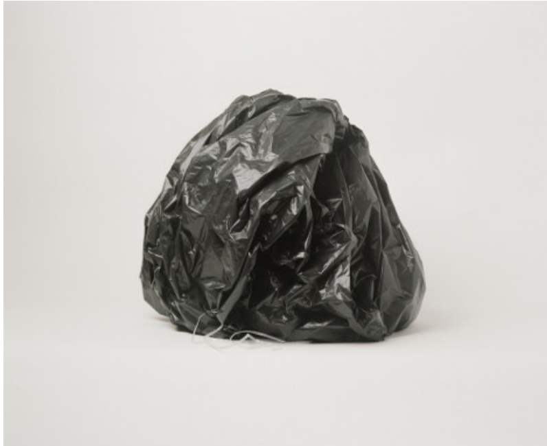
#23 - Le sac poubelle d'André