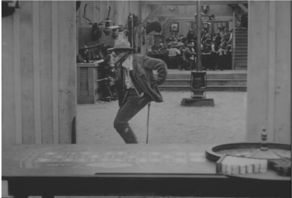
Figure 3. - Photogramme 2 - The Bargain , Réginald Barker (1914).